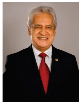
Carlos Xavier Presidente

Temos convicção de que a organização, a força, a determinação e a capacidade gerencial das mulheres, acostumadas ao desempenho de múltiplas funções e atividades, são características essenciais para liderar e contribuir com propostas e ações voltadas ao desenvolvimento do agro em nosso Estado. Contem com o apoio do Sistema Faepa/Senar para trilhar esse caminho, e construirmos juntos o desenvolvimento sustentável do agronegócio paraense, proporcionando segurança alimentar à nossa população e o progresso socioeconômico de nosso Estado.