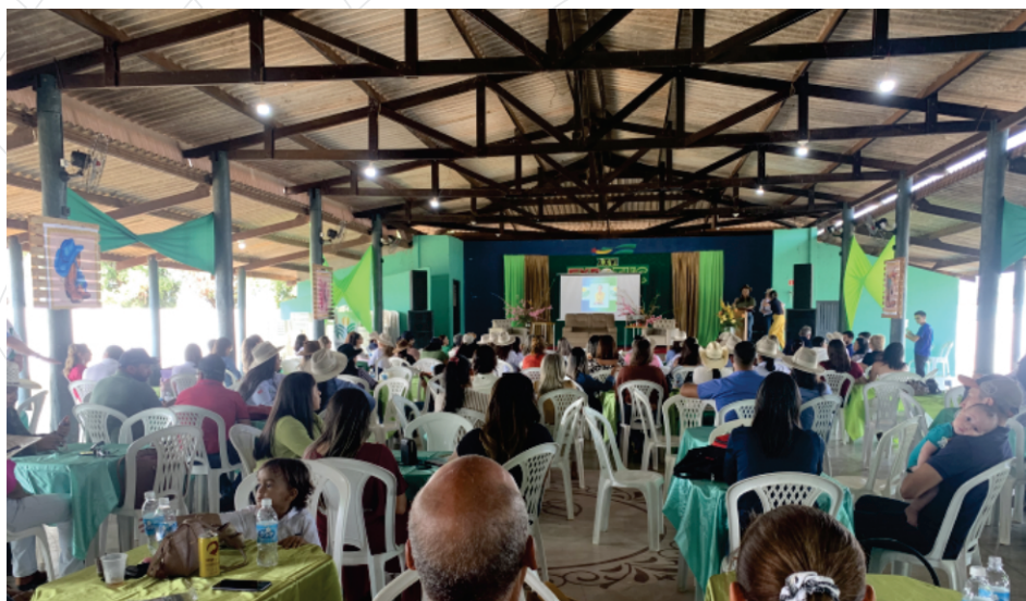
Manual orientativo para Implantação e Fortalecimento de Grupos Municipais de Mulheres do Agro junto à Federação da Agricultura e Pecuária do Pará - FAEPA